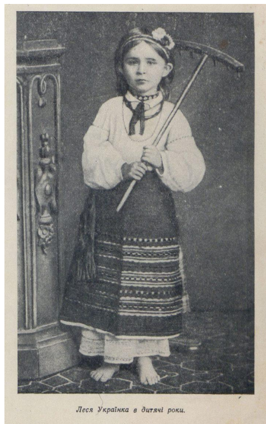
Леся Українка в дитячі роки.

Інтелектуальні ігри Леся теж обожнювала. Наприклад, написати оповідку-експромт на будь-яку тему за короткий час на пів аркуша. Саме з такої гри народилось Лесине оповідання «Жаль».